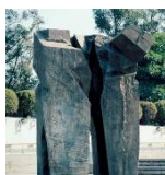
雕塑 2 (太極拱門): 創作者：朱銘 媒材技術：青銅 尺寸：210 × 275 × 375 cm