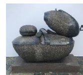
雕塑 3 (船): 創作者：瑞佛拉·梅立頓 媒材技術：黑花崗石 尺寸：200 × 94 × 150 cm