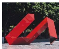
雕塑 1 (紅不讓): 創作者：李再鈞 媒材技術：不銹鋼、烤漆 尺寸：620 × 440 × 229cm